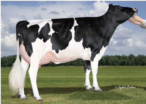
AOT SALVATORE HICCUP GRANDDAM