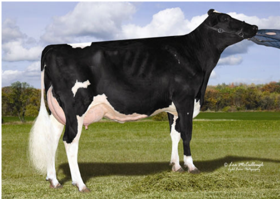
COOKIECUTTER MOM HALO FOURTH DAM